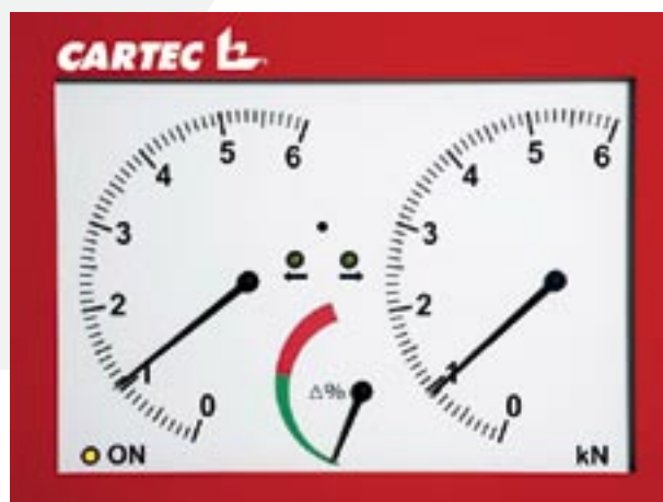
Analogový panel 0 – 6 kN