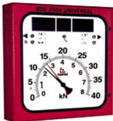
Panel s ukazateli s dvojitou stupnicí